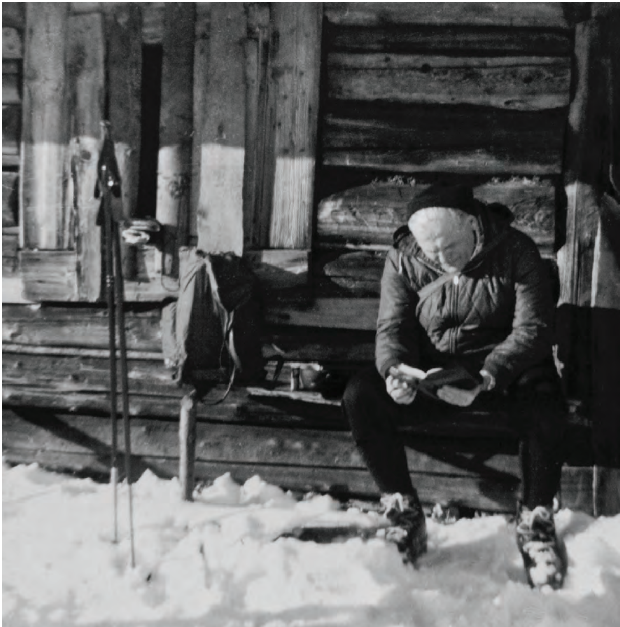
Chwila modlitwy przed szałasem tatrzańskim, lata 50. XX w.