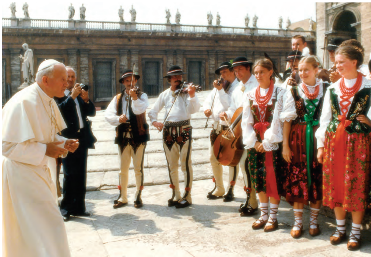
Zespół góralski gra i śpiewa dla Ojca Św. w Watykanie, fot. NN, arch. Jan Chyc, b.r.