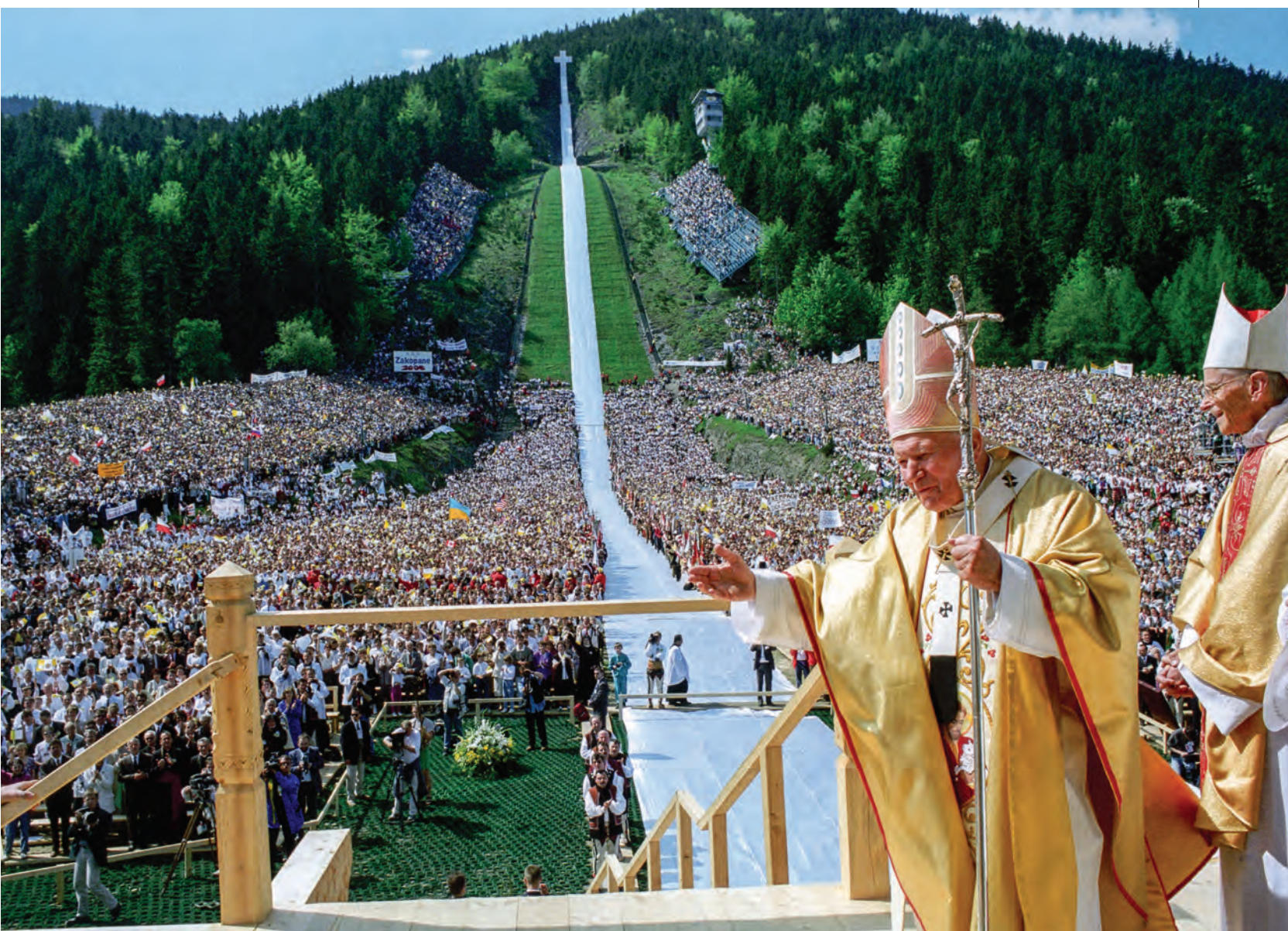
Widok na Wielką Krokiew i zgromadzonych wiernych, 6 czerwca 1997 r.