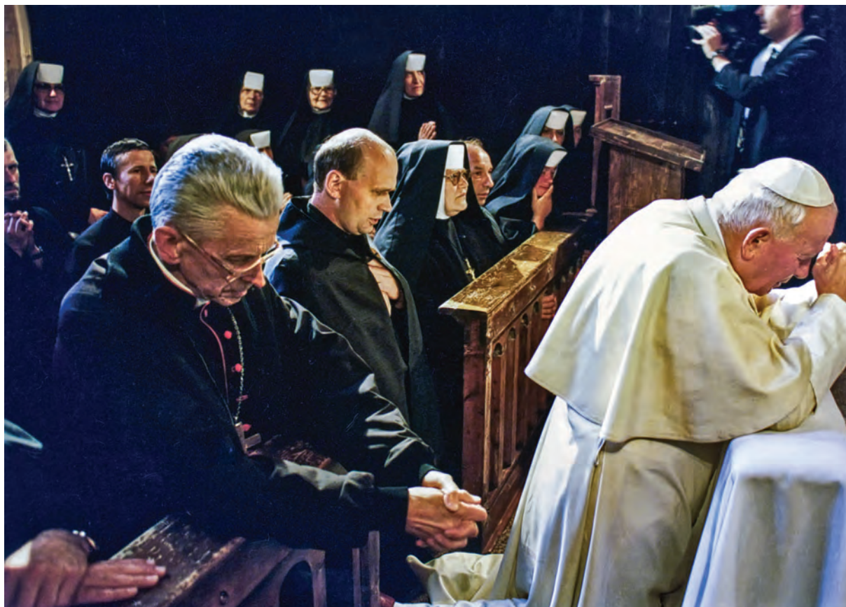
Kalatówki, Pustelnia Brata Alberta, fot. „L'Osservatore Romano”, arch. Siostry Albertynki Zakopane, 5 czerwca 1997 r.