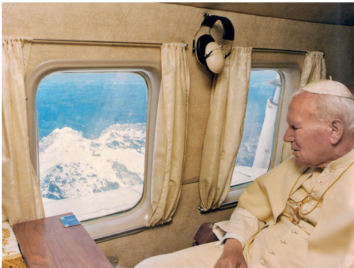
Pożegnanie z Tatrami, fot. „L'Osservatore Romano”, arch. Urząd Miasta Zakopane, 1997 r.