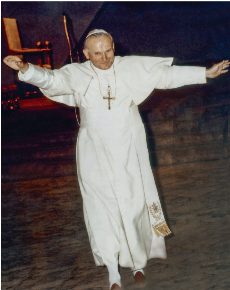
Ojciec Św. Jan Paweł II