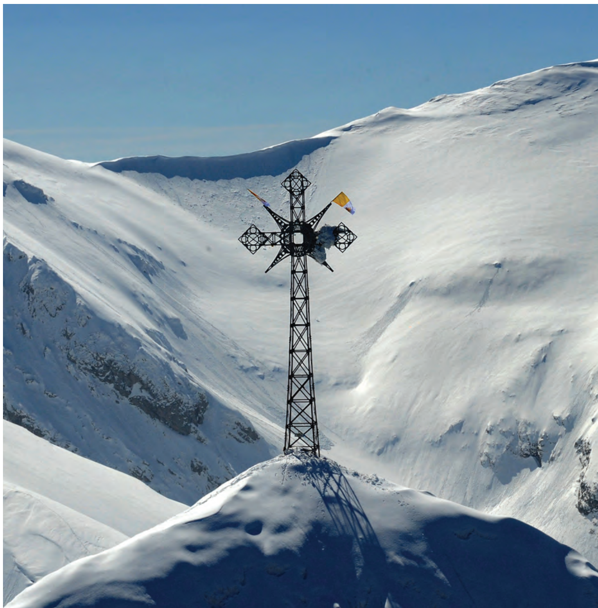
Papieskie flagi na Giewoncie, fot. Bartłomiej Jurecki, 2 kwietnia 2009 r.