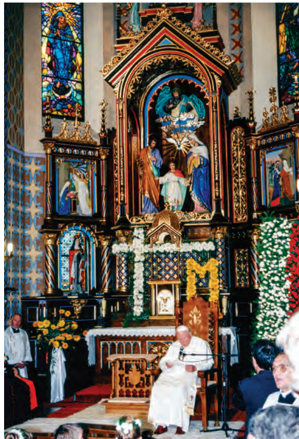
1 | 2 1 Kościół Najświętszej Rodziny, fot. ks. Stefan Misiniec, 1997 r.