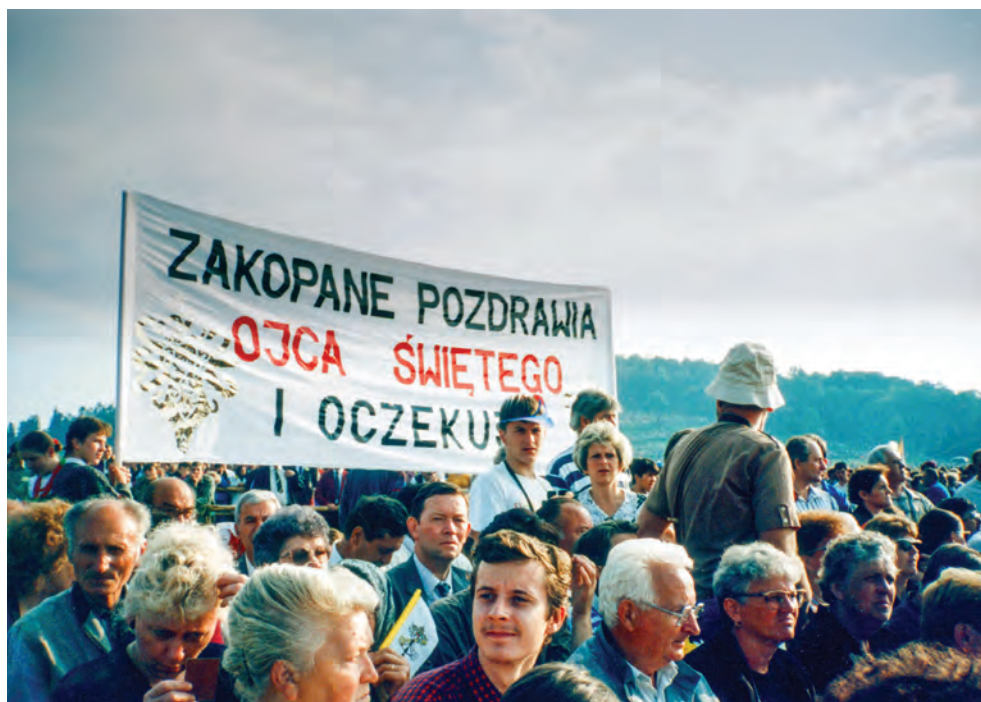
Pielgrzymi z Zakopanego w Lewoczy podczas wizyty Ojca Św. Jana Pawła II, 3 lipca 1995 r.

Módlmy się, by Matka Boska z Lewoczy doprowadziła papieża do Zakopanego. Niech górale tu pielgrzymują i modlą się o to. Z pomocą Bożą, mam nadzieję, że Ojciec Święty dojedzie do Zakopanego.