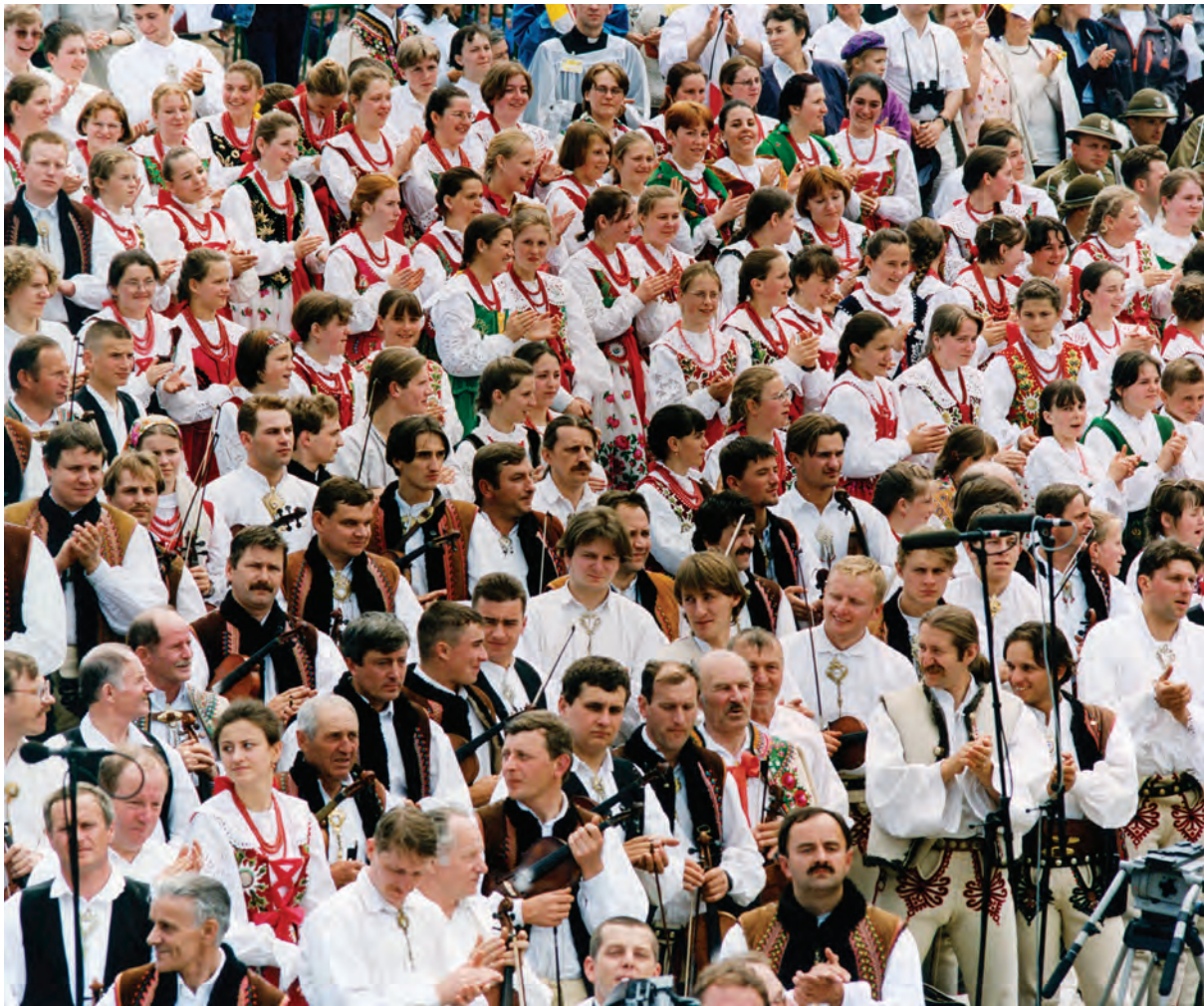
Połączone zespoły góralskie podczas Mszy św. pod Wielką Krokwią, fot. „L'Osservatore Romano”, arch. Anna Michałczak, 6 czerwca 1997 r.