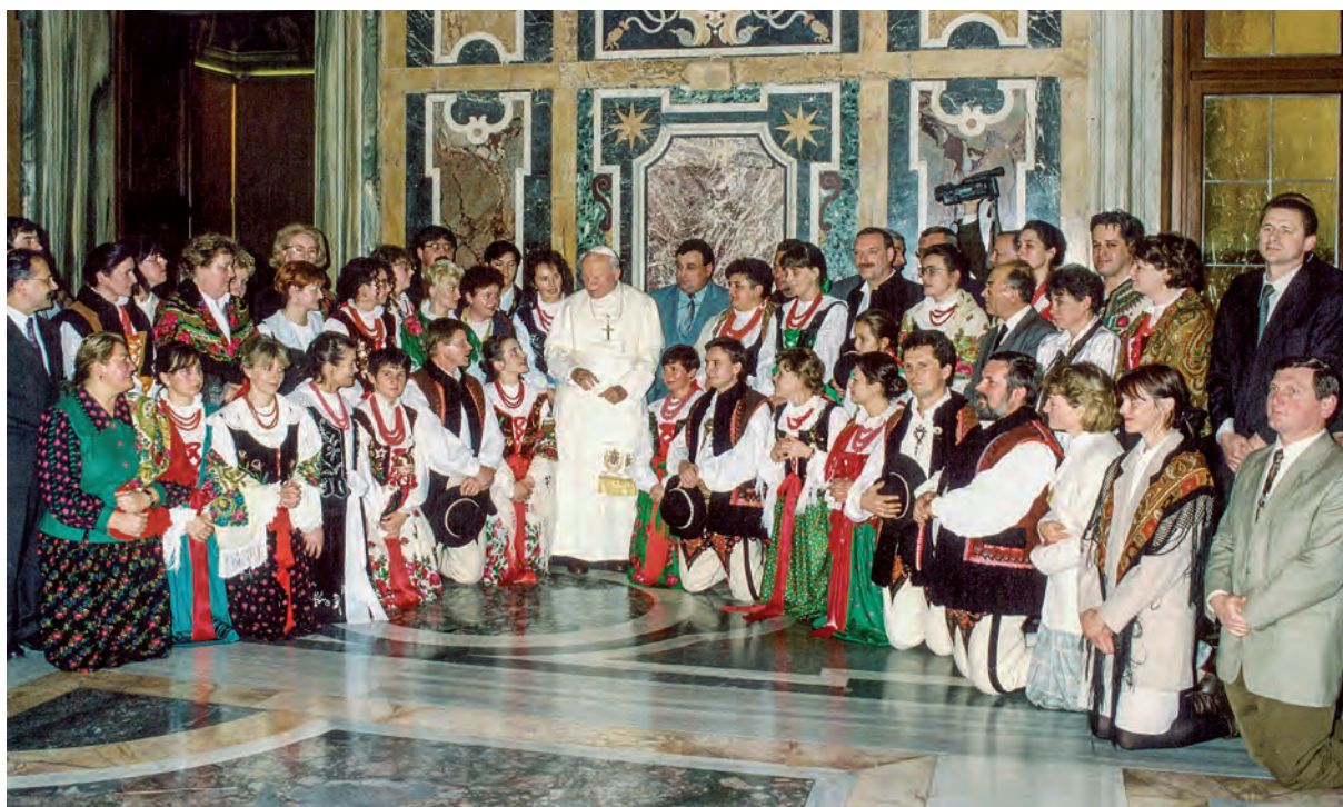
Delegacja pracowników Urzędu Miasta Zakopane w Watykanie, 1995 r.